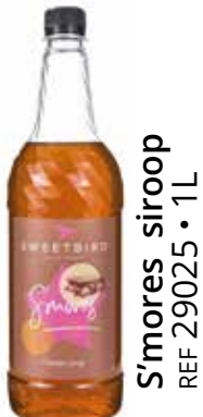
S'mores siroop REF 29025 • 1L