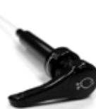
Pomp Siroop REF 29300