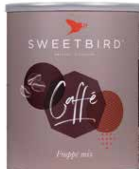
Caffé Frappé REF 29150 • 1kg