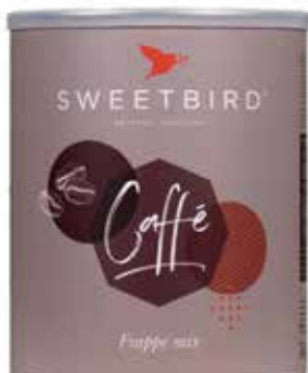
Caffé Frappé REF 29150 • 1kg