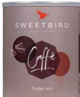
Caffé Frappé REF 29150 • 1kg