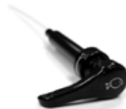
Pomp Siroop REF 29300