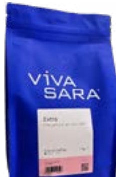
Koffie Extra REF 85000 • 1KG