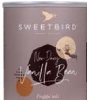
Vanille Bean Frappé REF 29151 • 2KG