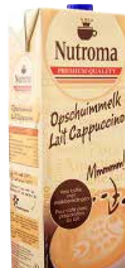
Opschuimmelk REF OPSCHUJIM