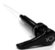
Pomp Siroop REF 29300