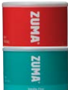
Zuma Vanille / Spiced Chai REF 29144 - 29143 • 1kg