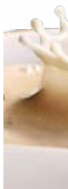
Nutroma Opschuimmelk REF OPSCHUIM / OP1 • 5l / 1,5l